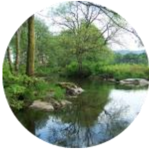
Préservation et restauration des milieux naturels et de la biodiversité