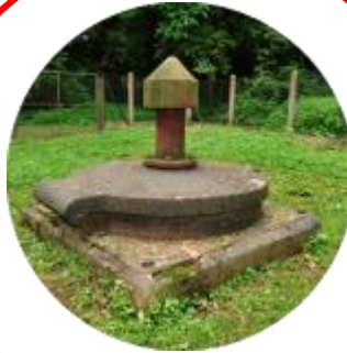
Protection de la qualité de la ressource en eau