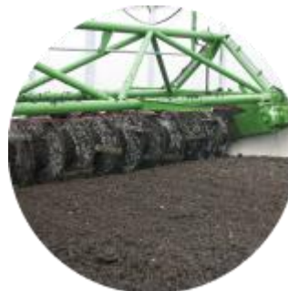
Primes de résultats