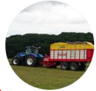
Lutte contre la pollution d'origine agricole