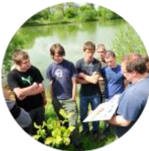
Sensibilisation, éducation, information