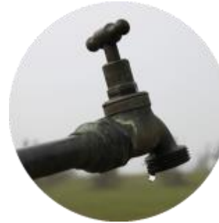
Gestion quantitative de la ressource en eau