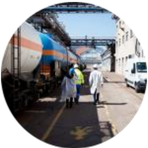
Lutte contre la pollution générée par les activités économiques