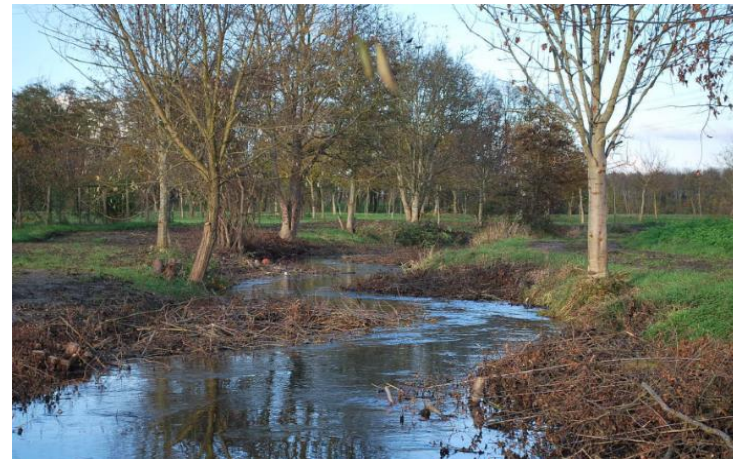
Langertgraben à Muttersholtz (Commune de Muttersholtz - 2017)

Ces propositions seront modifiées, complétées ou supprimées au fil des discussions des prochains mois.