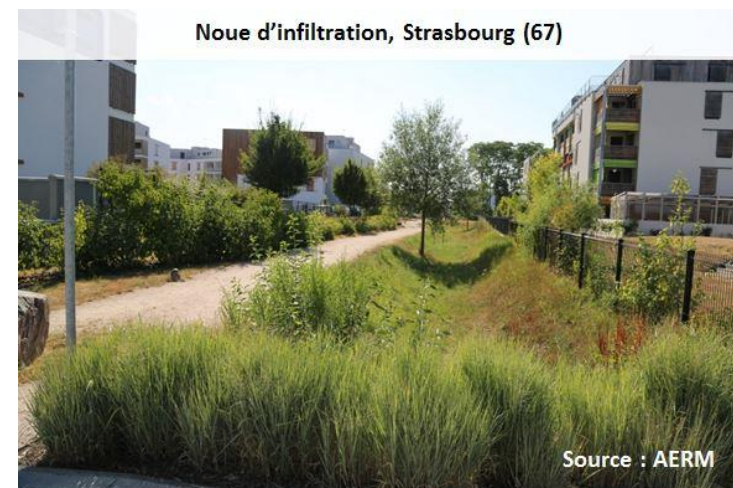
Noue d'infiltration, Strasbourg (67)