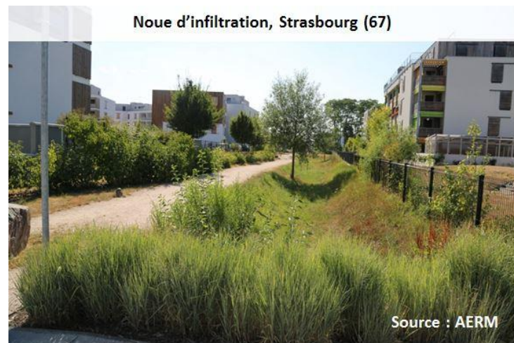
Noüe d'infiltration, Strasbourg (67)